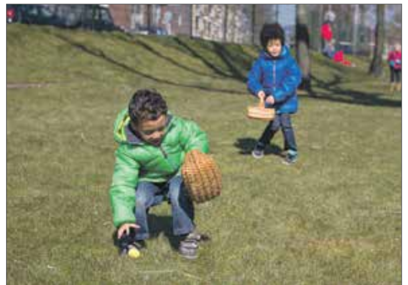
Kinderen zoeken naar eieren met Pasen.

Cor Hartsink met de kinderboerderij stopte kwam het drietal met het idee om de huidige kinderboerderij op te richten. Zij klopten aan bij de gemeente die het idee ondersteunde. Het drietal vormde samen met Petra Oostenrijk en Ingrid van Koningsveld het bestuur van de Stichting Kinderboerderij Diemen.